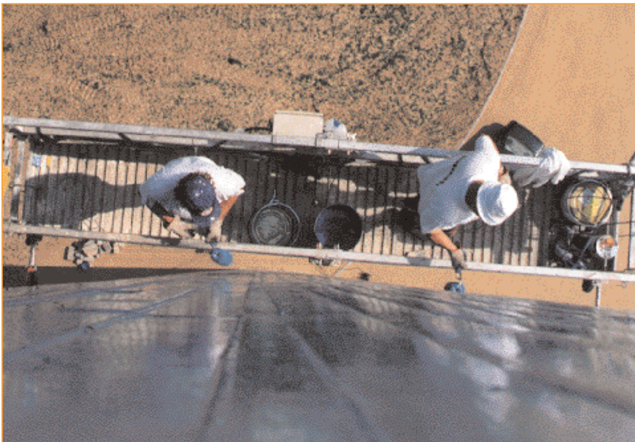
Deux compagnons de la Sogeb-Mazet à l'ouvrage sur la façade du bleu château d'eau de Montmarault.