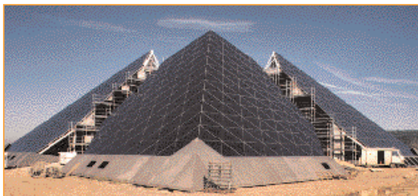
L'un des chantiers phares de la SOGEB-MAZET en 1998.