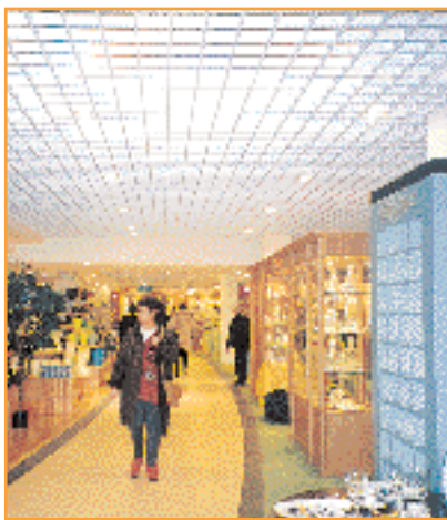
Le plafond "résille" signé SOGEB des Galeries Lafayette de Nantes.