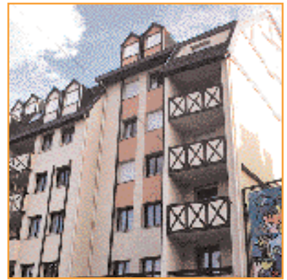
Au cœur de Montluçon, la SOGEB rénove de nombreuses façades.

Depuis sa mise en place, il y a exactement dix ans, l'intéressement a représenté pratiquement 2 millions de francs (exactement 1.967.234F), soit près de 200.000F par an en moyenne. ■