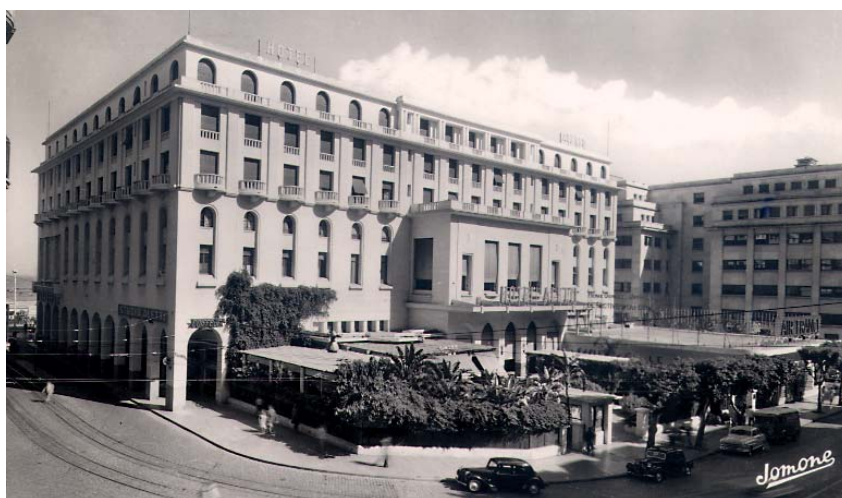
L'hôtel Aletti d'Alger : un des premiers chantiers de prestige pour la Sogeb à la fin des années 40.