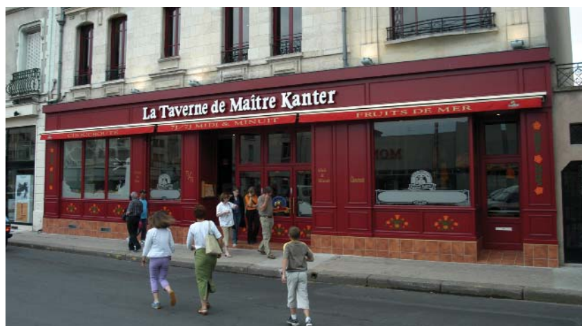
La Taverne de Maître Kanter à Montluçon : le 1 er chantier de Prolynôme.

P rolynôme, c'est l'alliance du professionnalisme et d'un polynôme , somme algébrique de monômes, donc d'individualités. Six individualités bien connues sur le bassin montluçonnais et bien au-delà et qui avaient l'habitude de travailler ensemble, de manière informelle, sur des chantiers extérieurs : dans le sillage de la Société nouvelle de menuiserie Aumaître, les entreprises Aéro-Services (chauffage, climatisation, ventilation, plomberie), Auvitu (électricité, alarme, domotique), Verreries du Centre (miroiterie, vitrerie, survitrage, agencement de magasins, vérandas) et la Sogeb-Mazet, sans oublier une société de maçonnerie-carrelage. La somme des savoir-faire de chacune leur permet d'appréhender la quasi-totalité d'un chantier. Pourquoi, alors, ne pas se fédérer