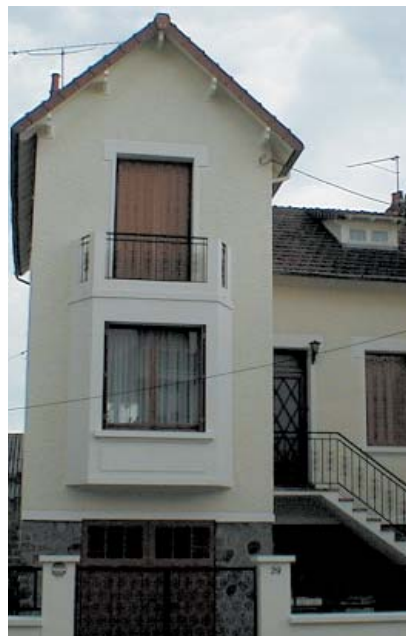
Un pavillon montluçonnais aux façades toutes fraîches après le passage de la Sogeb.

Et de citer des exemples : la peinture des façades de pavillons à Évaux-les-Bains et à Montluçon (de quoi occuper deux compagnons pendant deux à trois semaines) ou encore la réfection d'appartements entiers ici ou là pour le compte du syndic montluçonnais Régie Guers, un client dont s'occu-