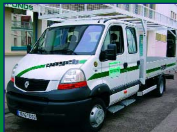
Dernier arrivé, un Master 6 places avec plateau aménagé.

Avec les deux Citroën C15 acquis tout récemment, le parc de véhicules de la Sogeb-Mazet compte actuellement 52 cartes grises, soit des camionnettes, des fourgons,