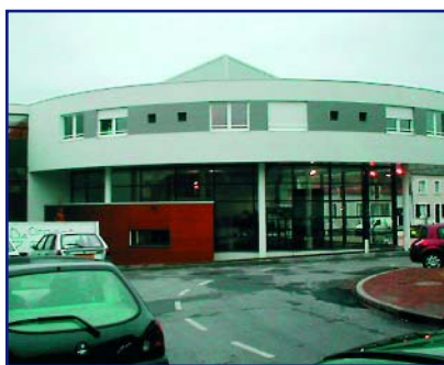
Hôpital de Saint-Amand (plafonds et sols).

À Grossouvre , dans le nord du Cher, aux confins de la Nièvre, un intéressant chantier de peinture à l'ancienne (couleur brique) est en cours dans une ancienne tuilerie promise à devenir