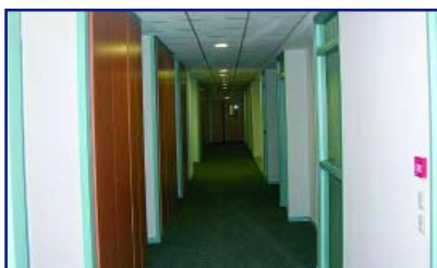
Le Parvis, à Clermont-Ferrand.

Ces deux derniers chantiers seront livrés en février prochain (Le Parvis) et au début du printemps (le CHU, où le groupement Dumez-Socae suit les